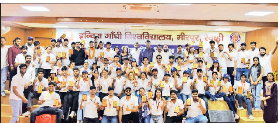
रेवाड़ी। एनएसएस शिविर के समापन पर स्वयंसेवकों को सम्मानित करते अतिथि।

इंदिरा गांधी विश्वविद्यालय में चल रहे सात दिवसीय एनएसएस शिविर का समापन हो गया। शिविर के अंतिम दो दिनों में विभिन्न शैक्षणिक, सामाजिक एवं सांस्कृतिक गतिविधियों का आयोजन किया गया। स्वयंसेवकों ने स्वर्ग लोक आश्रम में अभियान चलाकर स्वच्छता का संदेश दिया।