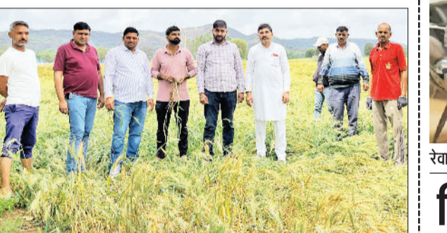
रेवाड़ी। खेत में बिछी गेहूं की फसल का मुआयना करते हुए।