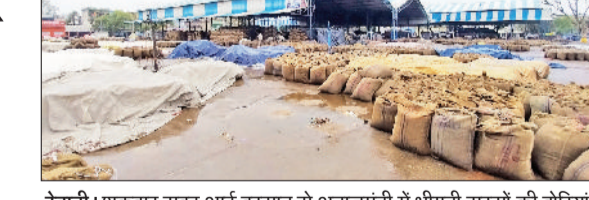
रेवाड़ी। शुक्रवार सुबह आई बरसात से अनाजमंडी में भीगती सरसों की बोरियां।

एक सप्ताह बाद साफ होगा मौसम मौसम विभाग का अनुमान है कि लगभग एक सप्ताह तक मौसम इसी तरह का बना रह सकता है। शनिवार को भी आसमान में बादलों के बीच हल्की बारिश या बूदाबांदी हो सकती है। इस दौरान ओलावृष्टि से भी इनकार नहीं किया जा सकता। मौसम का मिजाज ठंडा पड़ने के बाद बिजली की खपत काफी कम हो गई है। यह 60 यूनिट से भी नीचे आ गई है। आंधी के बाद बाधित हुई बिजली व्यवस्था को सुचारु किया जा चुका है।