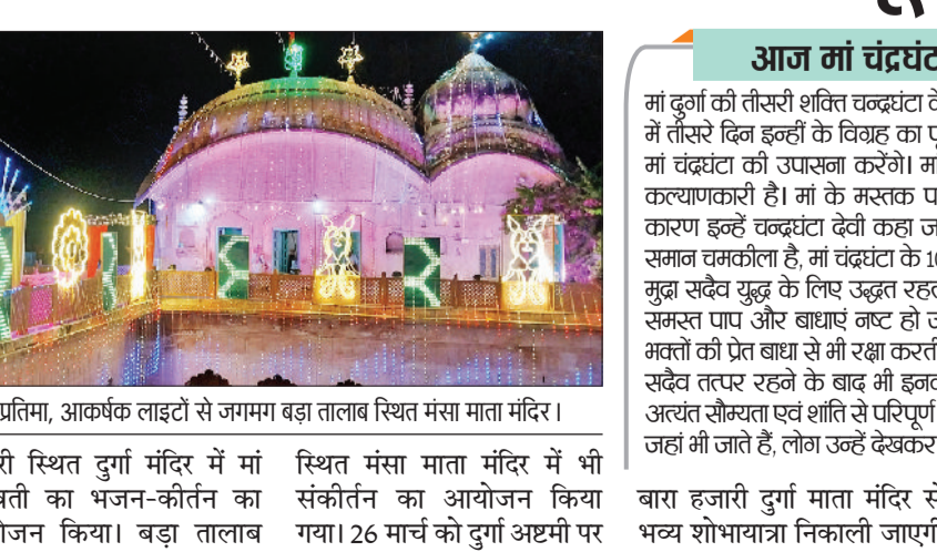
रेवाड़ी। खेत में बिछी गेहूं की फसल का मुआयना करते हुए।