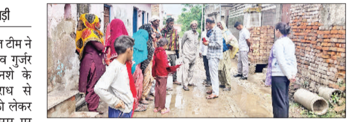
रेवाड़ी। ग्रामीणों को जागरूक करते हुए पुलिस टीम।

का भविष्य भी अंधकारमय कर देता है। उन्होंने ग्रामीणों से अभियान से जुड़ने का आह्वान किया। नशा मुक्ति टीम ने ग्रामीणों को साइबर अपराध के खतरों से भी अवगत कराया। उन्होंने बताया कि साइबर अपराधों फोन कॉल, सोशल मीडिया या अन्य माध्यमों से व्यक्तिगत जानकारी