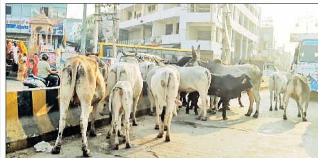
रेवाड़ी। सरकुलर रोड पर लियो चौक के पास गोवंश का जमावड़ा।

बाद फर्म को वर्क ऑर्डर जारी कर दिया है। नगर परिषद की ओर से गोवंशों को पकड़कर गोशालाओं में भेजने के लिए एक साल के लिए करीब 36 लाख रुपये का टेंडर किया गया है। नप अधिकारियों के अनुसार शहर से करीब 2000 गोवंश पकड़े जाएंगे। नगर परिषद की ओर से एक गाय पकड़ने 2000 रुपये, सांड के लिए 1980 व एक बछड़े को पकड़ने के लिए 1680 रुपये निर्धारित किए गए हैं। गोवंश के हमला करने से लोगों में काफी रोष है। शहरवासी लंबे समय से सड़क पर घूमते गोवंशों को पकड़ने की मांग कर रहे थे।