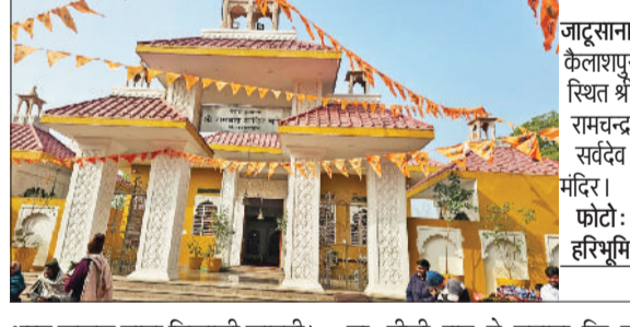
जाटूसाना। कैलाशपुर स्थित श्री रामचंद्र सर्वदेव मंदिर।