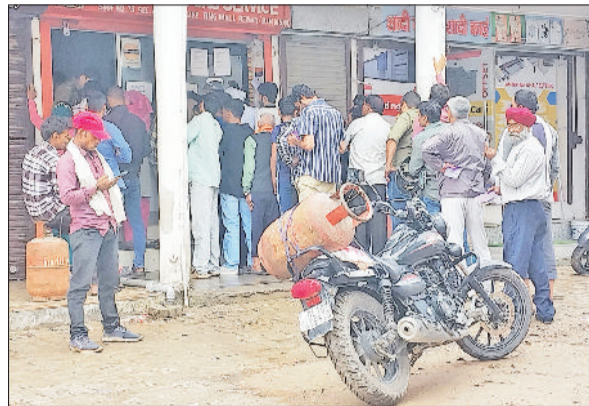
रेवाड़ी। इंडियन गैस एजेंसी पर सिलेंडर रिफिल कराने के लिए खड़े लोग तथा भारत गैस एजेंसी पर सिलेंडर लेते लोग।

■ किसी ने अटेंड नहीं किया विभाग का हेल्पलाइन नंबर