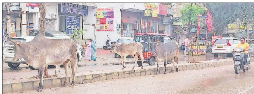
बावल रोड पर खड़े हुए गोवंश

शहर में सड़कों पर सैकड़ों गोवंशों का कब्जा रहता है। पशुओं की संख्या सर्वाधिक अनाजमंडी, सऊजीमंडी व महाराणा प्रताप चौक पर रहती है। सरकुलर रोड पर जगह-जगह गोवंशों का दिनभर जमावड़ा लगा रहता है। गोवंश सड़क पर बैठकर आराम फरमाते हैं। गोवंशों के कारण वाहन चालकों को आवागमन में भारी परेशानी का सामना करना पड़ता है, वहीं सड़क हादसों की आशंका भी बनी रहती है। बास मार्केट स्थित कचरा डंपिंग स्टेशन, लियो चौक स्थित एमआरएफ सेंटर, अगसेन चौक व राजीव चौक सहित कचरा प्लाईट पर हर समय गोवंशों का जमावड़ा लगा रहता है।