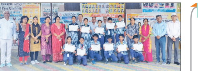
रेवाड़ी। विद्यार्थियों को सम्मानित करते हुए शिक्षक।