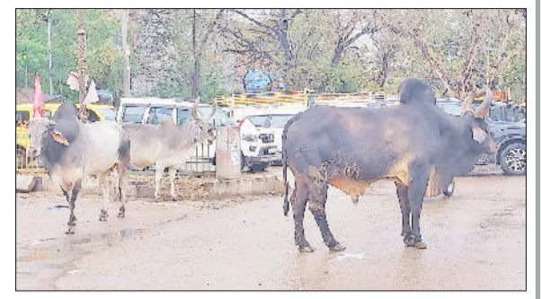
रेवाड़ी। महाराणा प्रताप चौक के पास रास्ता रोके खड़ा नंदी