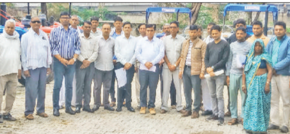
रेवाड़ी। अनाजमंडी में किसानों के ट्रैक्टरों का भीतिक सत्यापन करते अधिकारी।