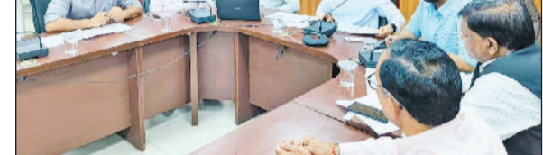
रेवाड़ी। विधायक अनिल यादव आमजन की समस्याएं सुनते हुए।