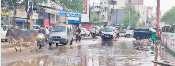
न्यूनतम लगाया जा रहा है। मध्यम वर्ग के पश्चिमी विक्षोभ की सक्रियता से बीते बुधवार की शाम से मौसम में अचानक बदलाव आया था। तेज आंधी के साथ बारिश और ओले गिरने से फसलों को काफी नुकसान